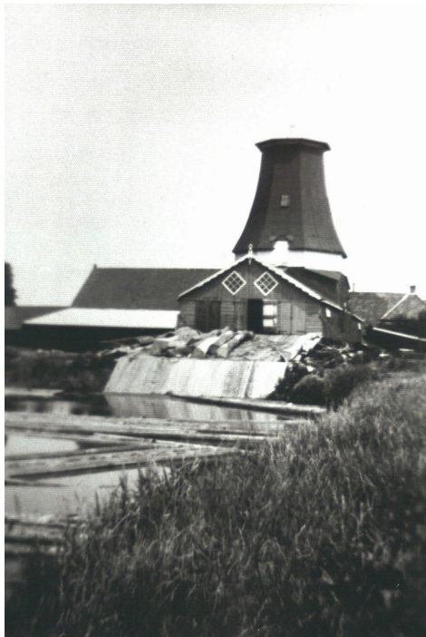
Houtzagerij Koops aan de Winsumerweg