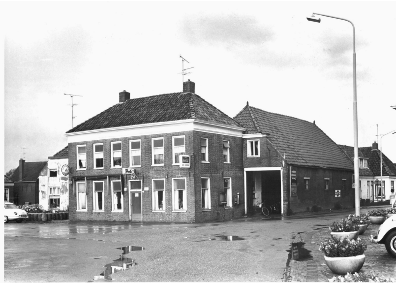
Pestman, Wouwnaar en twee generaties Leeninga tot 1978 de thuisbasis van de hengelclub

In het eerste jaar werden er zes wedstrijden georganiseerd waarvan er drie op een zaterdagmiddag (op zaterdagochtend werd in die tijd nog gewerkt) en drie op een zondag. Pas in 1961 werd gesproken om ook op de zaterdagochtend wedstrijden te organiseren. Maar dat bleek toen ook nog