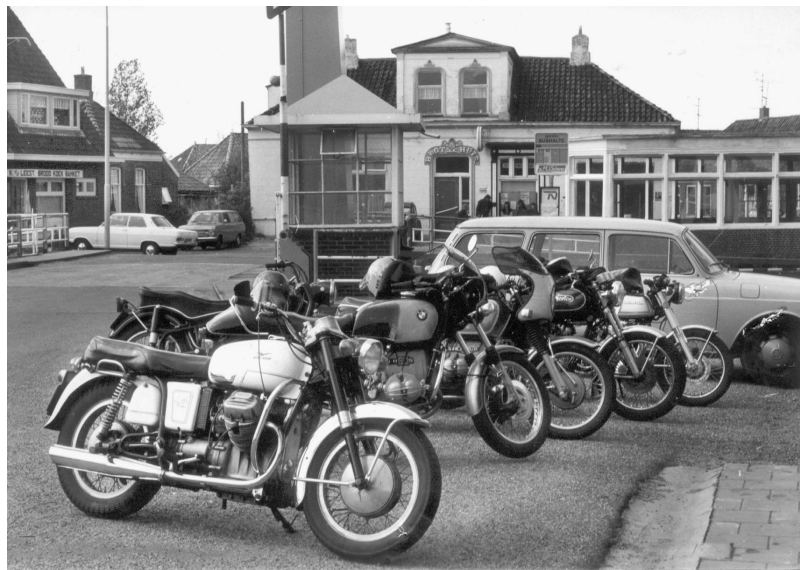
Bij Viswat in café Regthuis ontstond het idee

Dat zou ook zo zijn gebleven als die Bedumers maar niet zo enorm "Beems" hadden gehandeld. Want wat is het verhaal. Een inwoner van Bedum had een