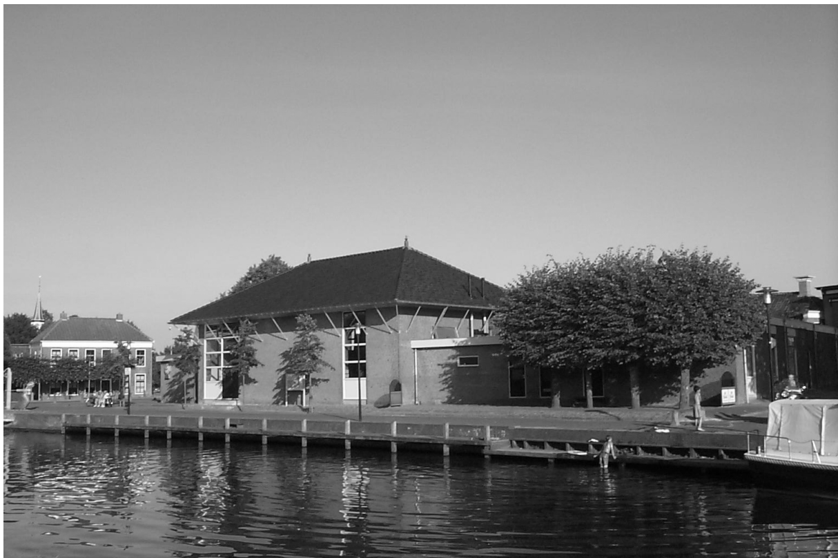
Het dorps huis vanaf 1978 het nieuwe clubhuis